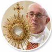
ADORACIÓN AL SANTÍSIMO ADORATION