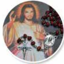
CORONILLA DIVINA MISERICORDIA CHAPLET OF DIVINE MERCY