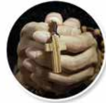
REZO DEL ROSARIO PRAYER OF THE ROSARY